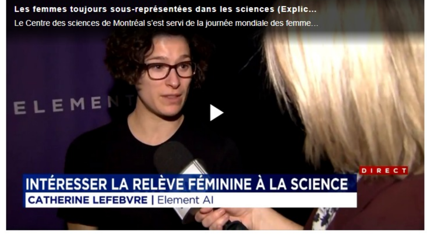
Les femmes toujours sous-représentées dans les sciences (Explic... Le Centre des sciences de Montréal s'est servi de la journée mondiale des femme...

«Souvent, les gens vont dire que les filles sont moins intéressées par les sciences, je pense qu'aujourd'hui, on voit que ce n'est pas le cas. Souvent, elles ne sont pas exposées à tout ce qui touche les métiers en technologie», a-t-elle dit.